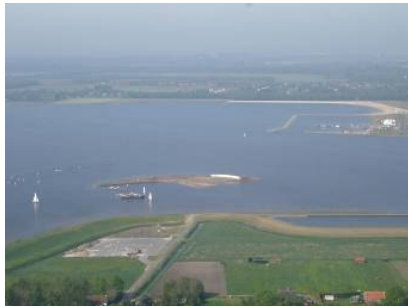
Het fraaie Oldambtmeer vanuit de lucht.

Men is druk bezig om het Blauwestadgebied zo aantrekkelijk mogelijk te maken voor de inwoners en de toeristen en recreanten. Zeker 25 kilometer nieuw fietspad, kilometers nieuw wandelpad, vier parkeerplaatsen en drie