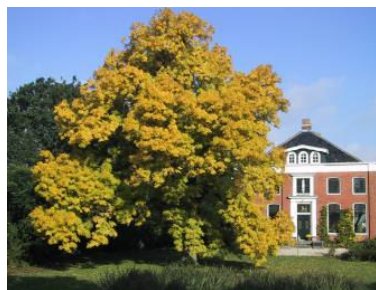
De monumentale goudes.

De storm die begin november over onze provincie raasde heeft veel minder overlast bezorgd dan aanvankelijk voorspeld werd. In de Eems en Dollard werd het zeewater door de noordwesterwind weliswaar tot 4 meter boven NAP opgestuwd, waarbij de dijken zwaar op de proef werden ge-