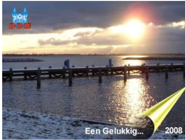
De wensen van het DDM.

Bijna op de drempel naar het nieuwe jaar, is het mijn gewoonte om even stil te staan bij allerlei gebeurtenissen die zich in het afgelopen jaar hebben voltrokken. Het jaar was nauwelijks begonnen of veel Midwolders en Oostwolders namen voor de eerste keer een Nieuwjaarsduik in het ijskoude water van het Oldambtmeer. Dit moet voortaan een traditie worden. De winter verliep bijzonder zacht en er kon dan ook niet op het Oldambtmeer geschaatst worden. Op 8 maart streek de landelijke media in Blauwestad neer om getuige te zijn van "Het Monster van het Oldambt." Er zou een enorm grote vis in het Oldambtmeer zitten. Na uitvoerig onderzoek bleek het te gaan om een snoek van 59 centimeter. Net niet groot genoeg om de wereldpers te halen. Op 28 april werd de Noordrand van Blauwestad officieel geopend. Een zeer belangrijke gebeurtenis voor de toeristisch/recreatieve ontwikkeling van de dorpen Midwolda en Oostwold. Drie dagen vierden we feest en konden we genieten van een