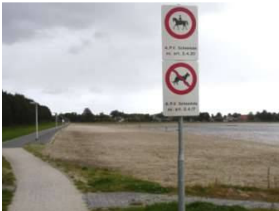
De borden langs de westkant van het strand.

Eind september werd de gehele noordrand van Blauwestad afgesloten voor honden en paarden, omdat er overlast was van uitwerpselen op het strand en de fiets- en voetpaden. Sommige honden- en paardenliefhebbers lieten hun dier (onaangeliend) op het strand, waardoor er soms uitwerpselen op het strand lagen. Dit kan natuurlijk niet. Ondanks dat er verschillende malen op is aangedrongen de honden vooral niet op het strand te laten, waren er toch een aantal mensen die daaraan geen gevolg gaven. De gemeente nam daarom een wel heel drastische maatregel en besloot verbodsborden te plaatsen langs de gehele noordrand. Hierdoor werden ook de goedwillenden de dupe. De hondliefhebbers konden niet meer hun vaste wandel- en fietstocht langs de westkant van het Oldambtmeer maken. Veel mensen werden daardoor boos. Het DDM heeft daarom bij B & W een voorstel ingediend om het hondenverbod voor de westkant van het strand tijdens de wintermaanden op te heffen. Dit voorstel werd echter verworpen. De politiek