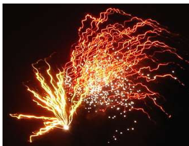
Een prachtige vuurpijl.

De jaarwisseling in Midwolda is goed verlopen. Nergens hebben er zich ernstige vernielingen voorgedaan. Door de regen en de harde wind was het dan ook geen pretje om op straat te zijn. Oudejaarsmiddag waren er her en der in ons dorp al zware knallen van carbidbussen, veelal oude melk-