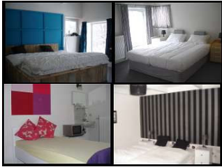
De kamers boven het voorhuis.

De verbouw van Blauwestadhoeve aan de Hoofdweg in ons dorp, tot een logiescentrum met indoor en outdoor faciliteiten, vordert gestaag. Het voorhuis van de boerderij is grotendeels klaar en in de enorme graanschuur wordt o.a. gewerkt aan de bouw van twee comfortabele vierpersoon familiekamers. Deze familiekamers zijn gevestigd in de voormalige meiden- en karnkamer. De bouw van twee cottages is ook al ver gevorderd. De bovenverdieping van het voorhuis, waar inmiddels vijf Bed & Breakfast kamers zijn gesitueerd, is vrijwel klaar. Iedere kamer op deze verdieping