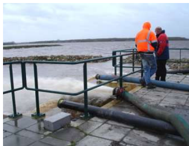
Problemen bij het gemaal Oostwold.

vier pompen geplaatst, met een gezamenlijke capaciteit van 2000 kuub per uur. Het water stond zeker een meter hoger dan normaal en verschillende siertuinen van omwonenden liepen voor de tweede maal deze winter onder water. Dit tot grote ergernis van de eigenaren. Direct aanwonenden denken dat de pomp in het gemaal Oostwold te klein is. Volgens woordvoester Bienenke Drenth van Blauwestad is dat niet het geval. Het gemaal voldoet volgens haar aan alle eisen. De onrust van de bewoners was vooral weer toegenomen, omdat eind vorig jaar de dijk bij de Nieuweweg water doorliet, waardoor er een