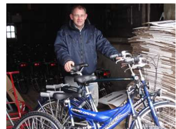
Comfortabele Union fietsen te huur.

Het uitgestrekte natuurgebied rond Midwolda is, mede door de komst van Blauwestad, uitermate geschikt om er met de fiets op uit te trekken. Men kan heerlijk door de pittoreske dorpjes en de uitgestrekte polders fietsen. Het landgoed Ennemaborg, het Midwolderbos, de Midwolderplassen, het natuurgebied De Tjamme en de fietspaden rond het Oldambtmeer lenen zich bij uitstek voor een tocht per fiets. Tot dusver was het in ons dorp nog niet mogelijk om fietsen te huren. Bij Blauwestadhoeve kunt u vanaf nu terecht voor het huren van een comfortabele Union fiets.