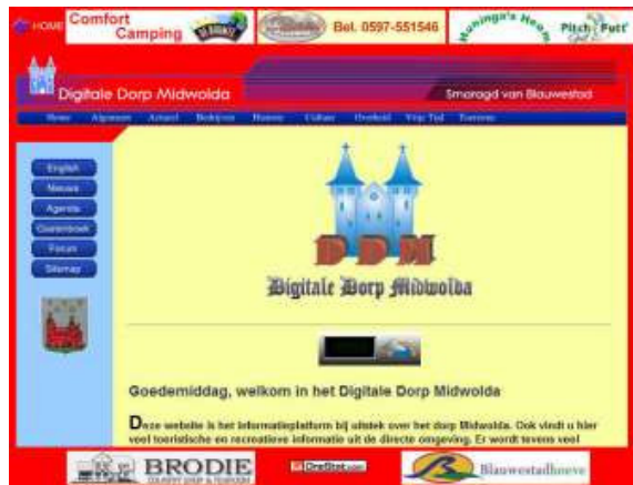
Website van het dorp Midwolda.

Het Digitale Dorp Midwolda (DDM) bestond op 1 januari jl. tien jaar. Op 1 januari 1997 ging het DDM, met het domeinnaam midwolda.nl, voor het eerst "in de lucht". Tien jaar geleden had nog vrijwel niemand internet en er waren nog weinig websites. Ik voorzag toen echter al een gouden toekomst voor het medium internet. In het eerste jaar bezochten nog slechts 793 bezoekers de Midwolder website. De site bestond toen nog uit weinig webpagina's, maar dat werden er al gauw veel meer. Steeds meer mensen kregen de beschikking over een internetverbinding. Dat was goed te merken, want de site werd steeds beter bezocht. Het DDM verwierf in 2001 landelijke bekendheid toen de site, door Gemeenteweb, verkozen werd tot nummer één in de Digitale Steden Top 50. Bij de verkiezing tot "Beste digitale stad van Nederland" werd het digitale dorp in 2001 tweede. Een mooie opsteker voor de promotie van Midwolda. In 2003 ontving het DDM de Culturele prijs van de gemeente Scheemda. Vorig jaar bezochten maar liefst 35.529 bezoekers de site en ze bekeken samen ruim 162.000 webpa-