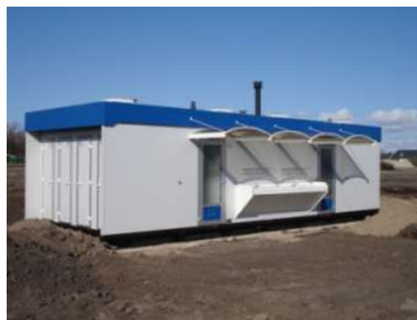
Het toiletgebouw bij de jachthaven.

zouden die voorzieningen reeds een zeker minimum niveau moeten hebben. Er worden serieuze pogingen on-