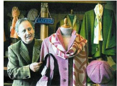
Britse traditie bij Brodie.