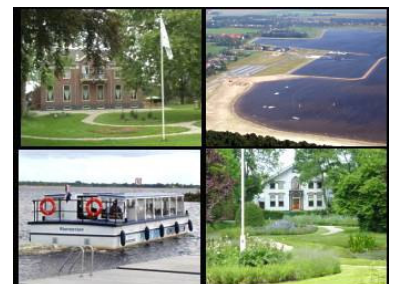
Slingertuinen en Oldambtmeer.