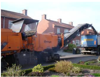
Het verwijderen van het wegdek.