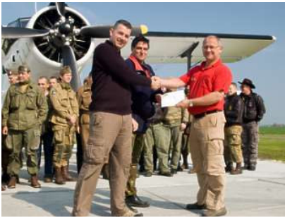
Overhandiging envelop met inhoud.

Eind april bleek weer eens dat het gebied rond het Oldambtmeer prima geschikt is voor recreatie op het land, op het water en in de lucht. Drie leden van Het Blauwe Lint, te weten